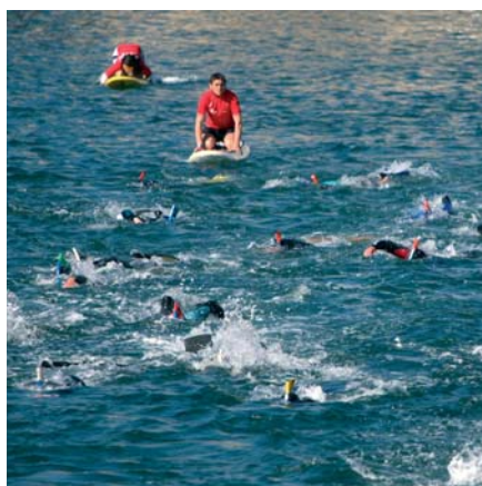
/ Les nageurs dans les canaux sétois