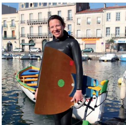
/ Une concurrente engagée en mono-palme

évoquer la traversée des Dauphins ? Elle est programmée le lundi 25 août, dans le cadre des fêtes de la Saint-Louis. A noter enfin que le club de sauvetage MNSL assure la sécurité sur ces événements.