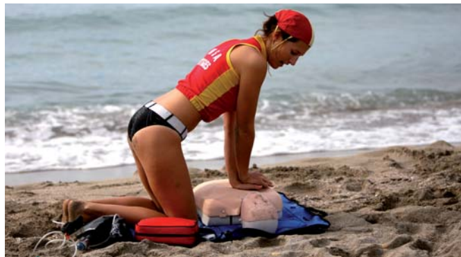
/ Commencer le massage cardiaque après l'alerte