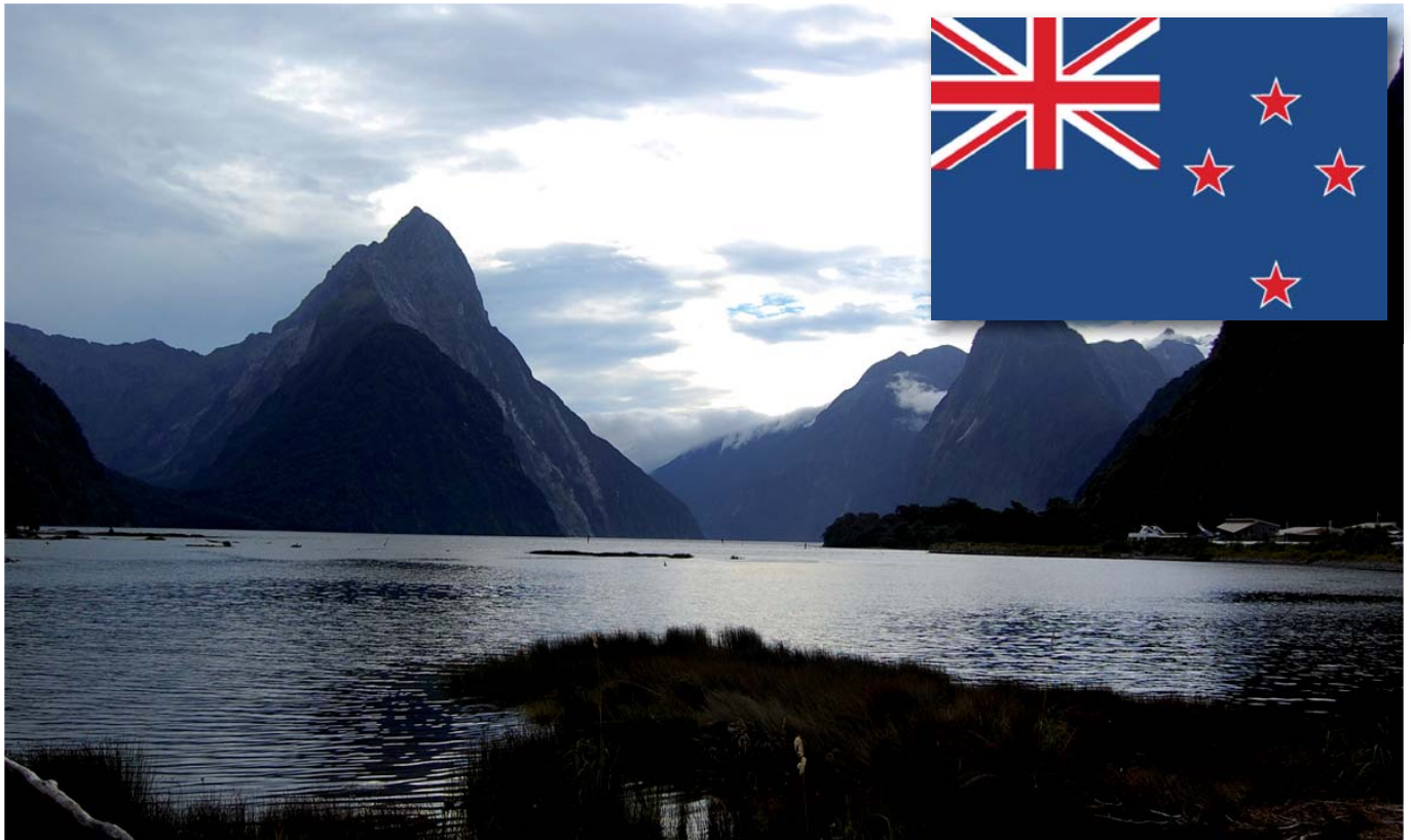
/ Milford Sounds (Île Sud)