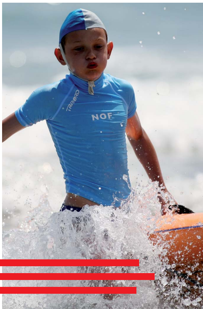
/ A l'Image de Frontignan, les associations affirment leur vocation sportive