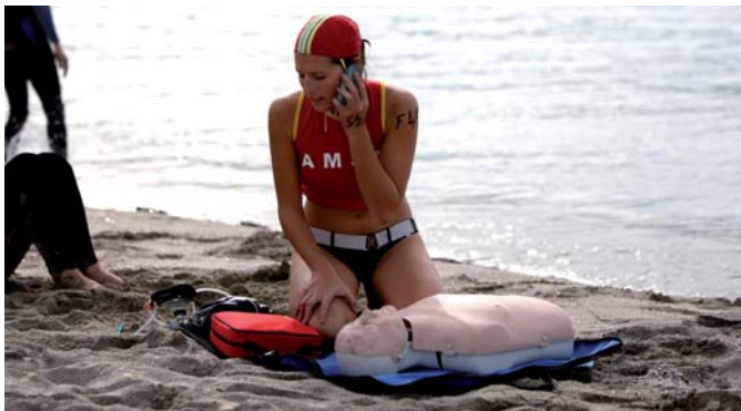
/ Alerter après avoir fait le bilan

Texte Guillaume Pace, Instructeur National de Secourisme.