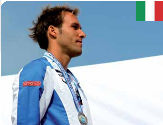
/ Federico Pinotti