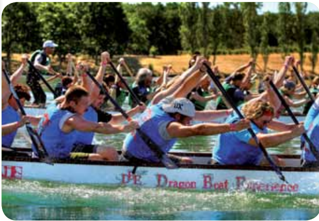
/ Besançon au top