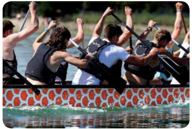
/ Les Sedannais en cadence