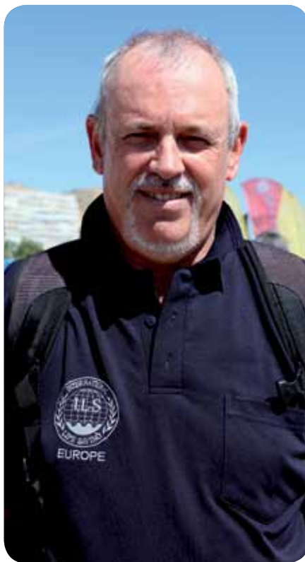
/ John Martin

C'est simple. Je coupe court à la polémique. Il n'y a pas de site, sur place, susceptible