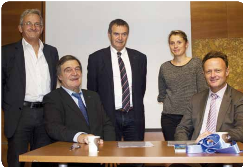
/ Signature de la convention à Paris