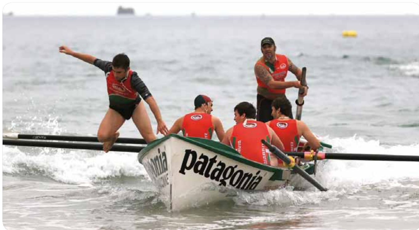
/ Les Biarrots, champions de France, accueilleront l'Ocean Thunder en septembre

World Rescue et Ocean Thunder à l'horizon